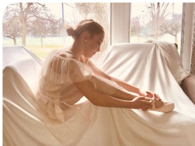
par Simone, 401