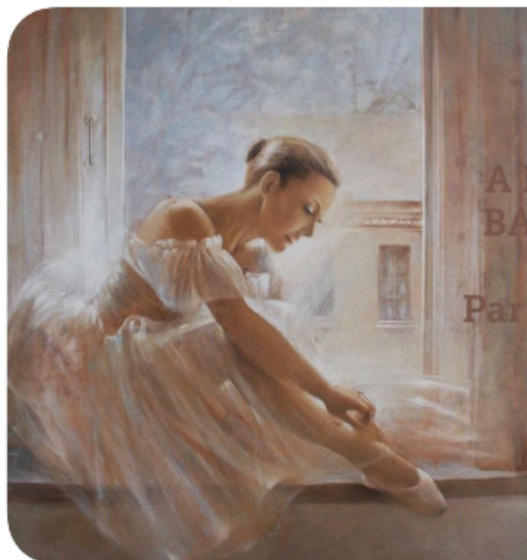
A NEW DAY BALLERINA DANCE Par Vali Irina Ciobanu